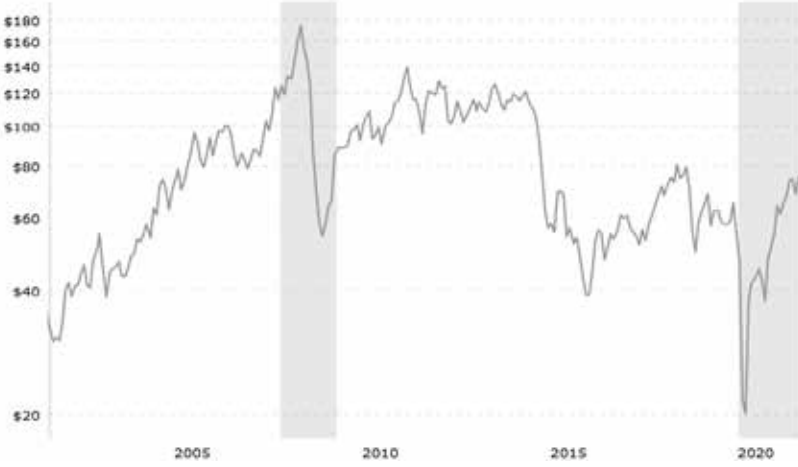
Tablo 1: 2000-2020 yıllarını kapsayan 20 yıllık petrol fiyatları. Koyu yerler dünyada yaşanan küresel kriz dönemlerini yansıtmaktadır (2008 Küresel Ekonomik Kriz ve 2019 Kovid-19 Pandemisi). (Kaynak: https://www.macrotrends.net/1369/crude-oil-price-history-chart ).

Hugo Chavez yönetime geldiğinde de artan petrol fiyatları ekonomide görece bir canlanmaya neden olmuş, ülkeye akmaya başlayan sıcak para ilk başlarda yönetimin elini güçlendirmiş ve Chavez hükümeti çeşitli sosyal sorunlarla ilgilenme fırsatı bulmuştu. Ancak Chavez hükümeti de ülke ekonomisinin temelini oluşturan petrol sanayiini başka gereçlerle destekleyerek çeşitlendirme yoluna gitmemişti. Daha da kötüsü Venezuela petrollerini işletme hakkına sahip olan kamu kuruluşu PDVSA'yı tamamen devletleştirerek kendi kontrolüne almış ve zamanla sadece yandaşlarını istihdam ettiği kuruluş bir müddet sonra verimsiz işlemeye başladığı için halihazırdaki petrol ihracatında ve gelirlerinde de düşüşler başlamıştı.